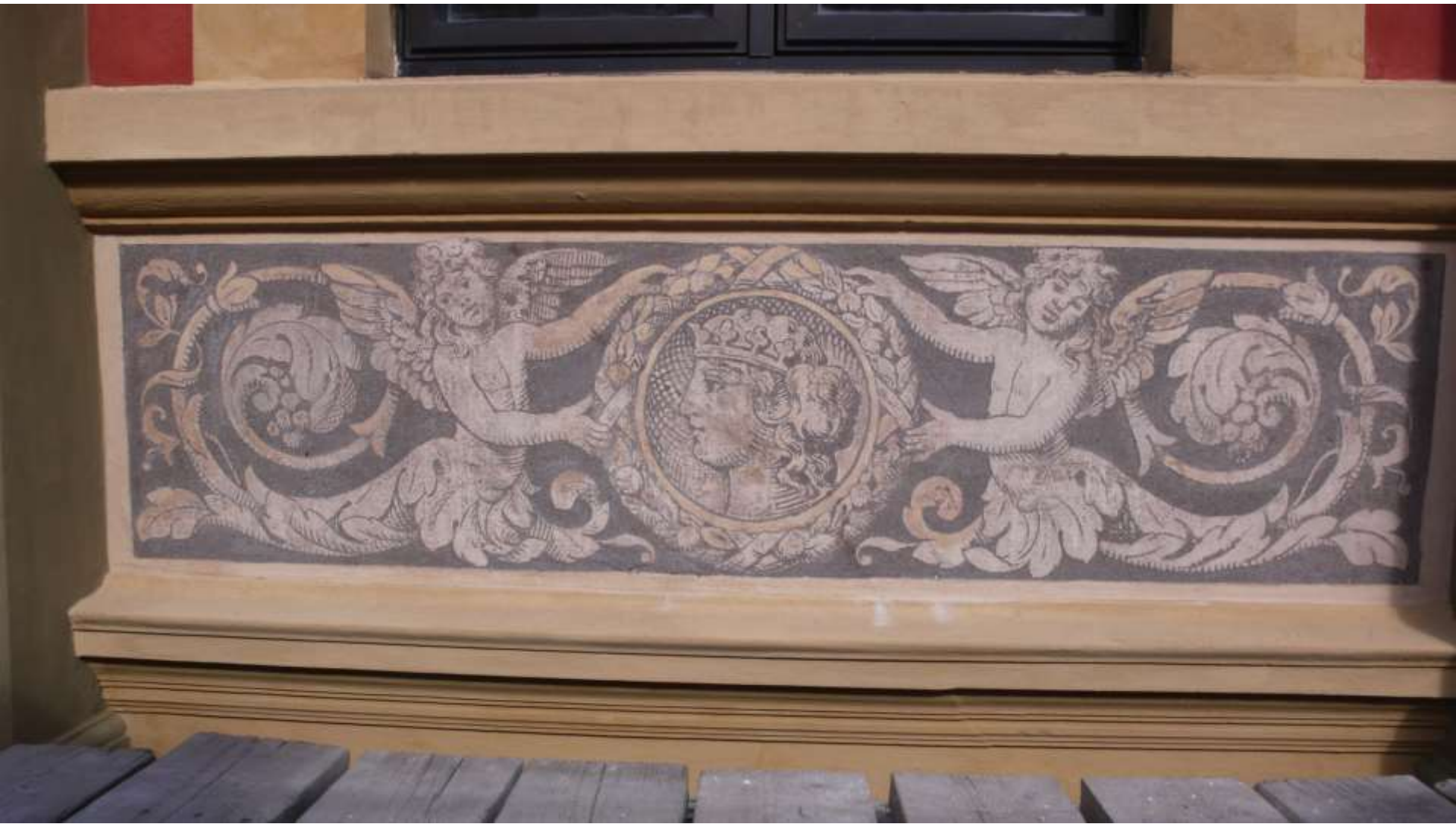
Engler/Kjeruber holdene medaljong med kronet kvinnehode